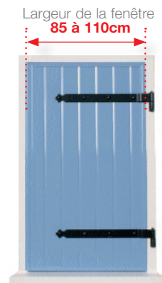
Un volet à 1 seul battant droit , poids maximum de 30kg