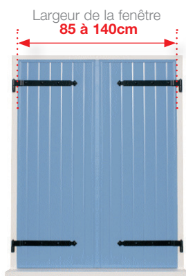
Un volet à 2 battants , poids maximum de 30kg par battant